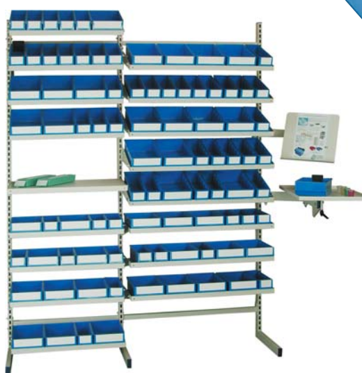
exemple 1 élément départ l 700, H 2000 mm 1 élément suivant l 920, H 2000 mm