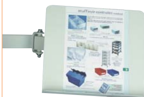
support document articulé réf. PC-SDA code 54620