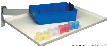
étagère articulée réf. PC-ETA code 54619