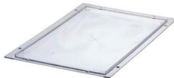
réf. MP640 module ou couvercle