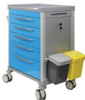
63002 / 63003 Chariot de soins 5 tiroirs équipés