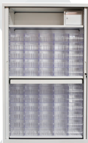
55.A3 Armoire par patient 55 résidents - 1200 x 430 x H1980 mm