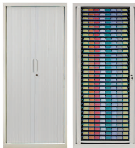
55.A1 Armoire piluliers 33 résidents - 810 x 550 x H1980 mm