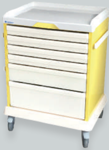
60.205000 Novelo 9