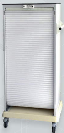
60.105020 Armoire à rideau 15 glissières