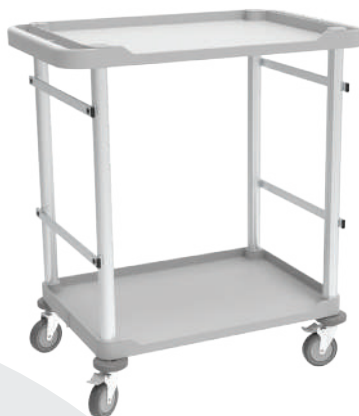
65101 Guéridon ABS Mdose