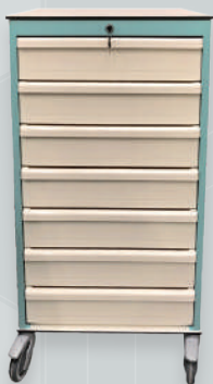
60.105008 Armoire 14 glissières