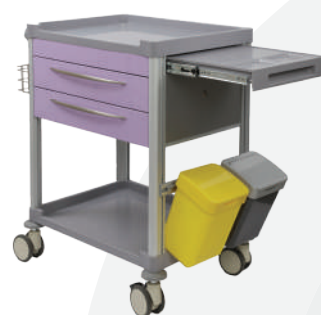
63004 / 63005 Chariot de soins 2 tiroirs équipés