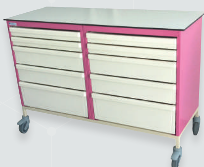
60.102020 Plan de travail double 18 glissières