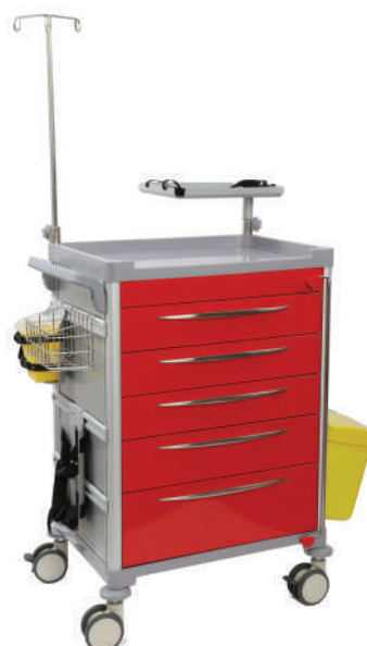
63001 Chariot d'urgence tout équipé