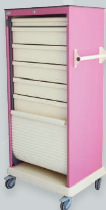
60.105015 Armoire à rideau 15 glissières