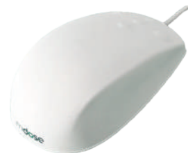
Souris antibactérienne IP68 Mdose

CATALOGUE COMPLET SUR SIMPLE DEMANDE OU EN TÉLÉCHARGEMENT SUR NOTRE SITE