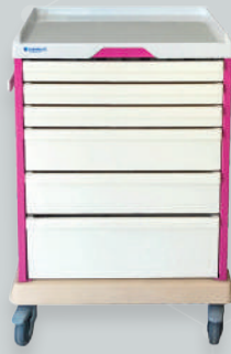
60.205020 Novelo 10