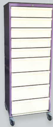
60.105005 Armoire 22 glissières