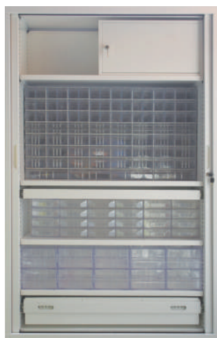
55.A13 Armoire par spécialité 1200 x 430 x H1980 mm