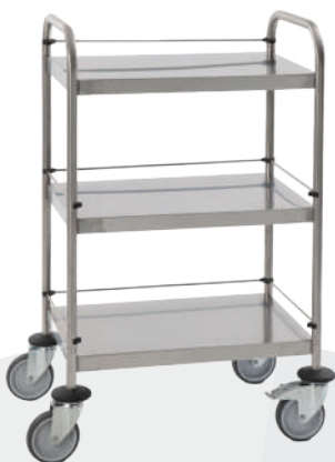
CH80579 Guéridon inox 600x400