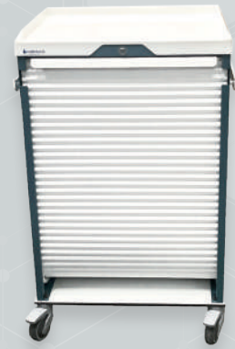
60.202039 Novelo rideau 11