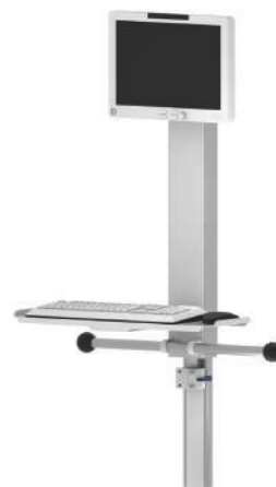
Colonne murale IT-LIFT