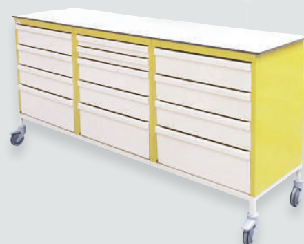
60.102030 Plan de travail triple 27 glissières