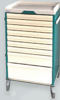
60.205050 Novelo 12