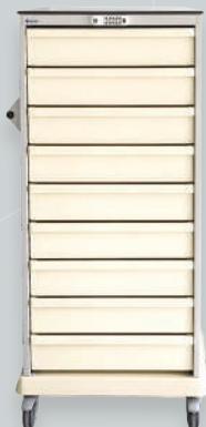
60.105012 Armoire 18 glissières