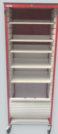
60.105017 Armoire à rideau 18 glissières