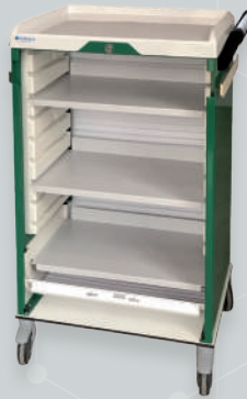
60.202036 Novelo rideau 9