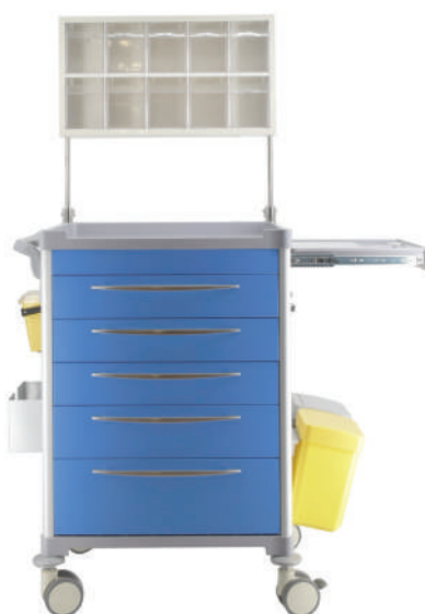
63010 Chariot d'anesthésie tout équipé