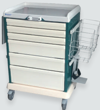
Chariot de soins