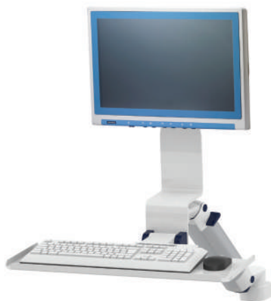
Fixation médicale écran / panel PC avec support clavier