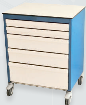
60.102010 Caisson 9 glissières