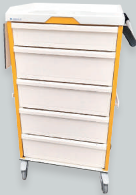
60.205052 Novelo 14