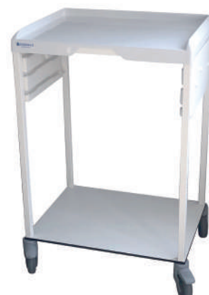
60.203042 Guéridon de service