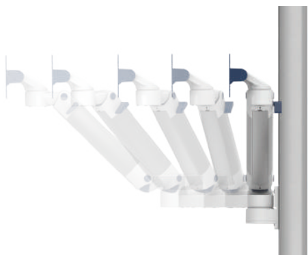
Bras pivot ajustable